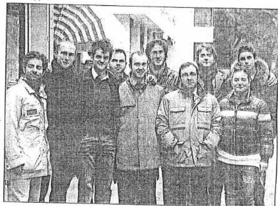
A sinistra: una sala del Planet. Sopra: il gruppo di giovani ricconesi

«Tagliare il numero dei cinema da sei a due significa far morire il Planet»