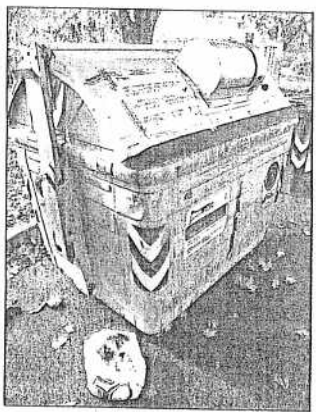
Un cassonetto rifiuti con il sistema E-gate

L'idea di fondo è che «da cultura rende l'uomo libero e l'uomo deve sentirsi libero di essere libero. Difendiamo la cultura, difendiamo l'economia perché la cultura non ha prezzo».