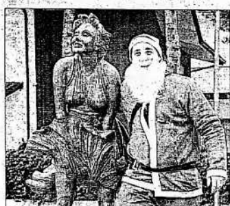
Lui ha trovato con chi festeggiare (Migliorini)

Tema retrò anche alla Tenuta del Monsignore di San Giovanni, che diventa a Capodanno "La Ville de Monsieur", festa con cena e dopo cena in un'affascinante dimora storica.