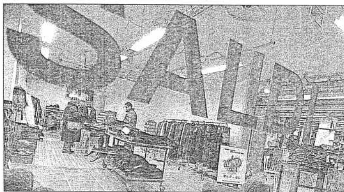
La partenza boom dei saldi ha fatto cadere il timore di flop tra i commercianti