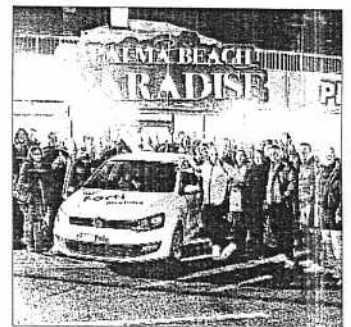
ti dagli altri sponsor: Napa abbronzatura, Comitato Riccione Paese, Ottica Francolini, Alba e Botteguita del Medio. Per ulteriori informazioni si possono contattare i Corsari all'indirizzo hilriccione@libero.it .

sionaria Forti di Riccione e parcheggiata davanti al locale (foto) è ancora ignaro probabilmente. Sarà comunque possibile riconfermare i numeri estratti anche nel sito internet dei Corsari, che lo ricordiamo è www.hockeyriccione.com in ogni caso i premi sono già ritirabili presso il Pattinodromo Comunale in via Carpi sin da oggi. Il primo premio, lo ripetiamo, una Volkswagen Polo è andata al biglietto numero 09110, il secondo premio: un open day di trattamenti presso Rimini Terme è stato assegnato al biglietto numero 00139, il biglietto terzo classificato invece, il numero 04558 è un "home stepper", per allenamenti casalinghi offerto gentilmente dai grandi magazzini Oliviero. A seguire sono stati estratti i numeri: 02610, 02081, 03737, 03264, 04991, 01369, 00230, 04678, 03842, 03781, 06654, 06060, 00460, 00318, 01555, 06187 ai quali sono stati assegnati molti altri premi, come occhiali da sole, trattamenti solari, aperitivi e bottiglie di rum, offer-