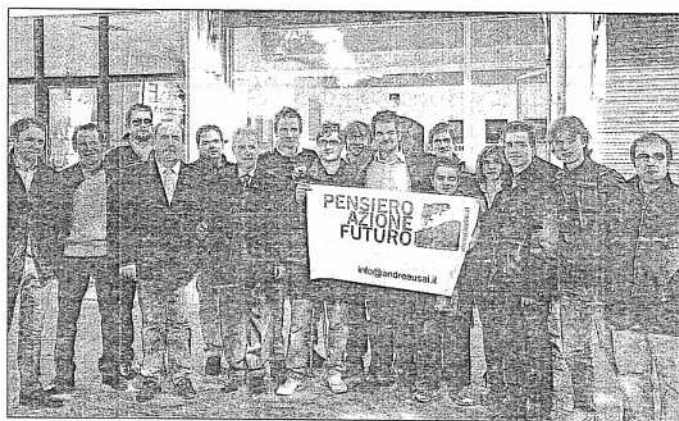
Foto di gruppo la nuova associazione di giovani del Pdl

Il sostegno di Renzi: «Un'alternativa a liste prive di novità»