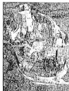
Una vista aerea della Rocca di Montefiore

MONTEFIORE - E' partita ieri l'intensa settimana a Montefiore. Fino a domenica 18 sarà possibile visitare la Rocca Malatestiana, acquistando un "passaporto dei castelli" al costo di 10 euro per visitare le fortezze di Montebello, San Leo e Verucchio, protagonisti dell'evento Castelli Fantastici all'interno del progetto Europeo Custodes. In particolare, nelle serate da mercoledì 14 al 18 luglio, il castello di Montefiore Conca sarà un castello da favola: Balli, combattimenti, amori e tradimenti alla Rocca di Montefiore in compagnia di damigelle e armigeri per vivere un momento magico al confine tra storia e favola. Spettacoli ore 19 e 21.30. Prenotazione obbligatoria. Info: 0541.980179. Oggi, martedì 13, appuntamento con "Io Bevo Ro-